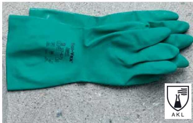
Fig. 20: guanti di protezione contro i prodotti chimici. Informatevi sul grado di protezione dei vostri guanti.

Le normali creme per le mani e per la cura della pelle non offrono nessuna protezione contro i prodotti chimici, ma favoriscono la rigenerazione della pelle dopo il lavoro 6 .