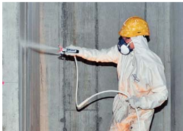
Fig. 19: quando si applicano a spruzzo prodotti contenenti solventi si devono sempre adottare le misure di prevenzione contro le esplosioni, oltre a utilizzare apparecchi di protezione delle vie respiratorie.