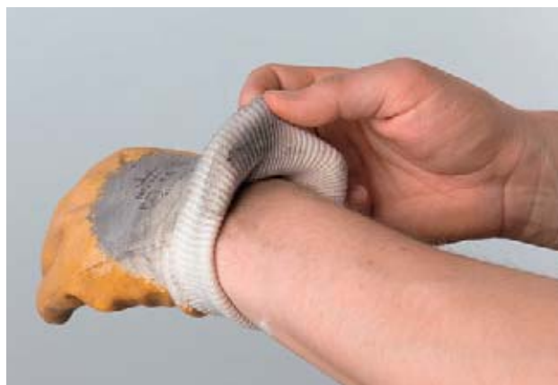
Fig. 21: lavorare indossando guanti sporchi è dannoso perché la pelle rimane a lungo a contatto con sostanze chimiche.