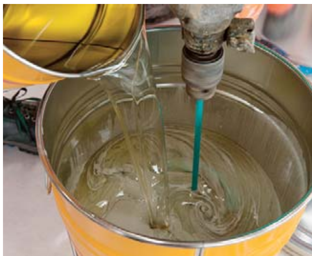
Fig. 6: le componenti della resina sintetica reagiscono fra loro. Può essere pericoloso per la salute.

Questi diversi tipi di resina hanno perlopiù in comune la reazione di due componenti pastose o liquide che si solidificano reagendo fra loro. La reattività delle componenti può essere causa di problemi di salute in caso di contatto con la pelle o inalazione dei vapori.