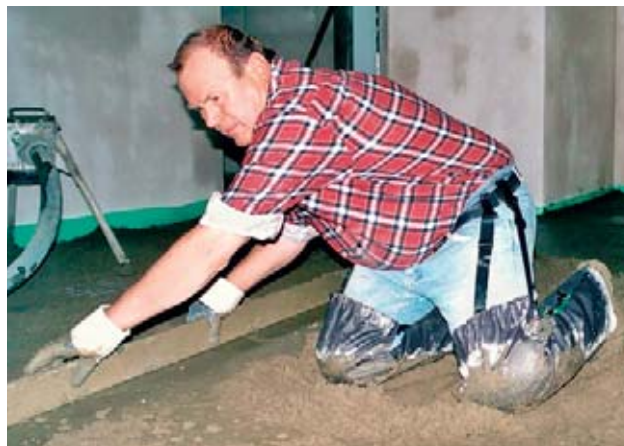
Fig. 15: con i «pantaloni di protezione» o le ginocchiere impermeabili si evitano le lesioni da cemento.

Maggiori informazioni: Lista di controllo Suva n. 67030 «Eczema da cemento»