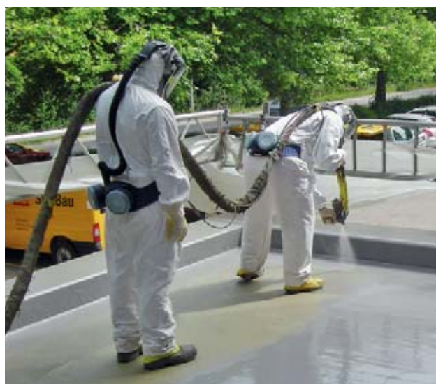
Fig. 12: per l'applicazione a spruzzo dei poliuretani sono necessarie severe misure di protezione, anche per chi si trova nelle vicinanze.