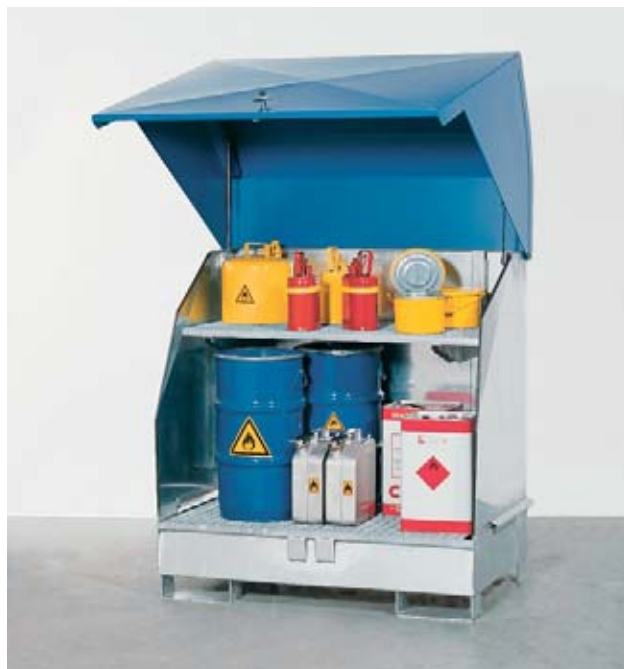
Fig. 27: deposito richiudibile per le sostanze pericolose

Siate prudenti quando maneggiate i contenitori che contengono ancora residui di prodotti chimici. Tenete presente che le prescrizioni per lo stoccaggio dei solventi si applicano anche ai rifiuti contenenti solventi.