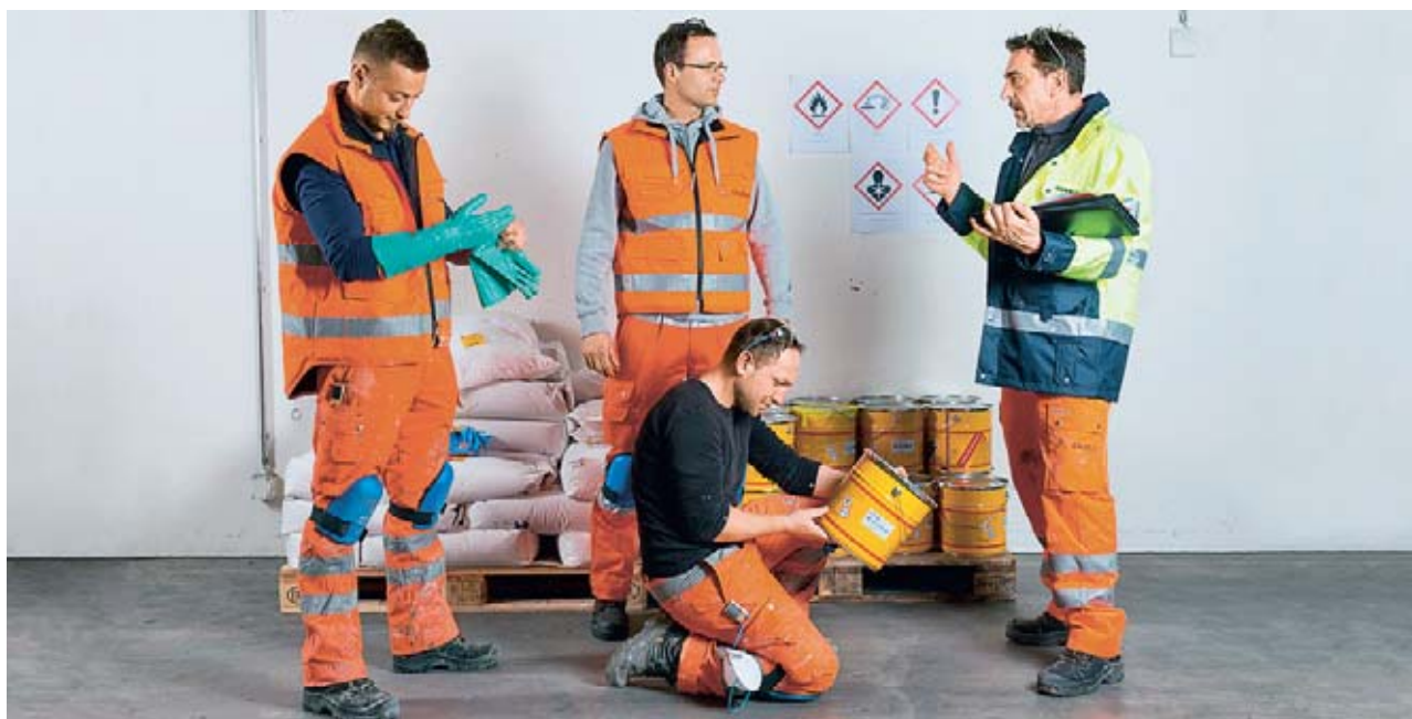
Fig. 5: istruite i vostri collaboratori sui pericoli e le misure di protezione direttamente sul posto.