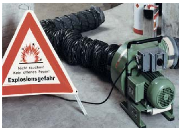
Fig. 18: utilizzate un ventilatore con protezione EX. Aspirare i vapori è molto più efficace che far confluire aria fresca dall'esterno.

Pubblicazioni Suva n. 1825 «Liquidi infiammabili» e n. 2153 «Protezione contro le esplosioni»