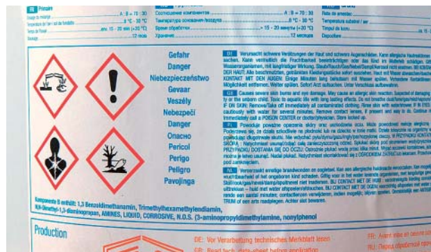
Fig. 9: avvertenza «Contiene epossidi». Talvolta le informazioni più importanti sono difficili da trovare.