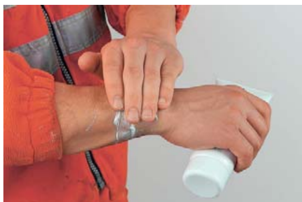
Fig. 22: applicata prima del lavoro, la crema garantisce una protezione di base contro i prodotti chimici.