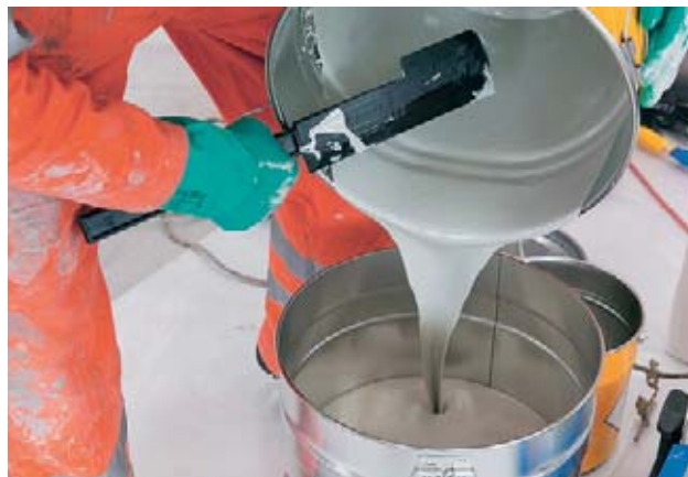
Fig. 8: per miscelare, pulire e travasare prodotti chimici è indispensabile indossare guanti di protezione adatti.