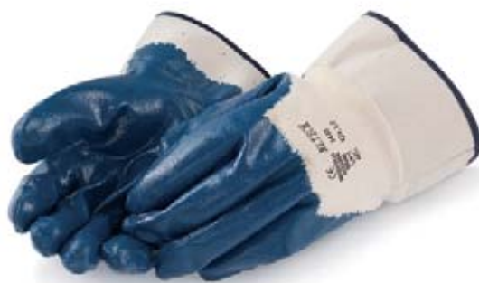
Fig. 16: i guanti foderati sono una buona scelta per lavorare con il cemento.