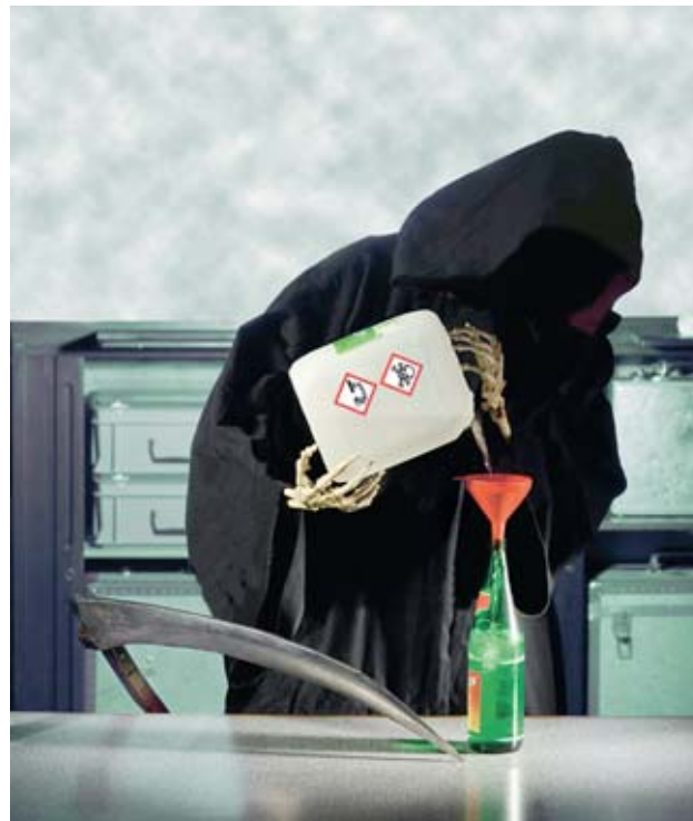
Fig. 25: mai travasare prodotti chimici in bottiglie per bevande!

Portate poi la persona ustionata dal medico o in ospedale, oppure chiamate il numero 144 .