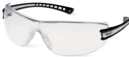
Fig. 24: degli occhiali di protezione leggeri sono sufficienti per ripare gli occhi da singoli spruzzi.