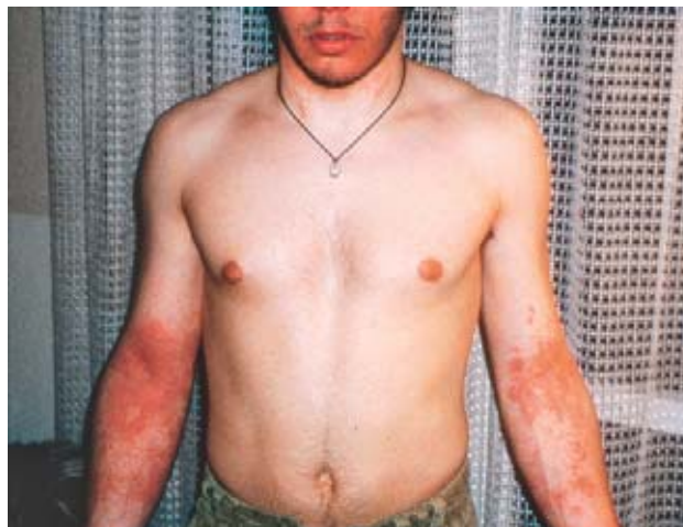
Fig. 10: la conseguenza del contatto con le resine epossidiche: un'allergia cutanea.