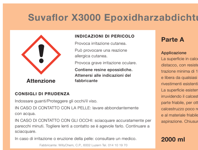
Fig. 1: l'etichettatura segnala i pericoli e le principali misure di protezione.

Anche sui contenitori riempiti in azienda bisogna indicare le caratteristiche pericolose del prodotto.