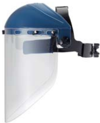
Fig. 13: una visiera protegge gli occhi e il viso quando si lavora con liquidi pericolosi.