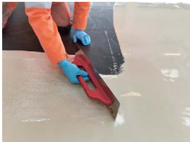
Fig. 7: i guanti monouso offrono solo una protezione limitata e sono ammessi unicamente se vengono sostituiti ogni volta che entrano in contatto con le resine sintetiche.

Le resine sintetiche possono entrare direttamente in contatto con la pelle anche quando le maniglie, i contenitori o simili sono sporchi. Rimuovete immediatamente i resti di resina, utilizzando lo strofinaccio una sola volta. Altrimenti, le tracce di resina contamineranno tutto l'ambiente di lavoro.