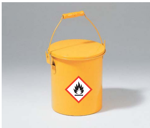
Fig. 17: contenitore chiuso e contrassegnato in cui immergere gli oggetti da pulire con il diluente

Evitate il contatto ripetuto con la pelle, ad esempio adoperando utensili o indossando guanti di protezione contro i prodotti chimici. I guanti monouso offrono solo una protezione limitata. Non permettete che i lavoratori si puliscano le mani con i solventi.