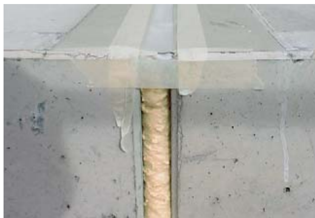
Fig. 11: sono molti i prodotti che contengono poliuretani, non solo le schiume per montaggio.