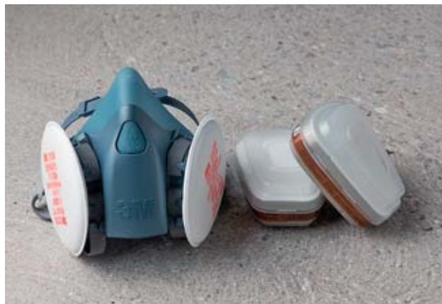
Fig. 23: una semimaschera con filtro antipolvere è utilizzabile più volte. Equipaggiata di un filtro a carbone attivo (a destra) protegge anche dai vapori dei solventi.

Le scarpe da lavoro impermeabili o gli stivali proteggono i piedi dal cemento e dalle resine sintetiche.