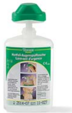
Fig. 14: un piccolo flacone per il lavaggio oculare (da 2 dl) trova posto ovunque.