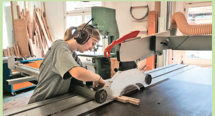
Bilder: Schreinerei Erich Widmer