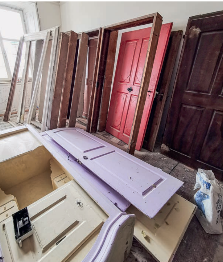
Sammelsurium an Material: Die alten Türen und Rahmen werden gelagert.