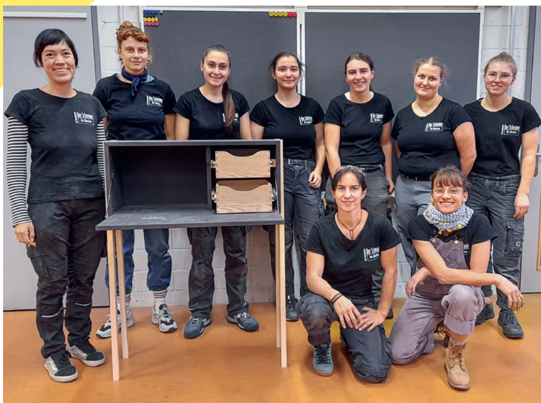
Die zweite Gruppe des Frauenförderung-Workshops stellt sich für das Abschlussbild mit einem Möbel auf.