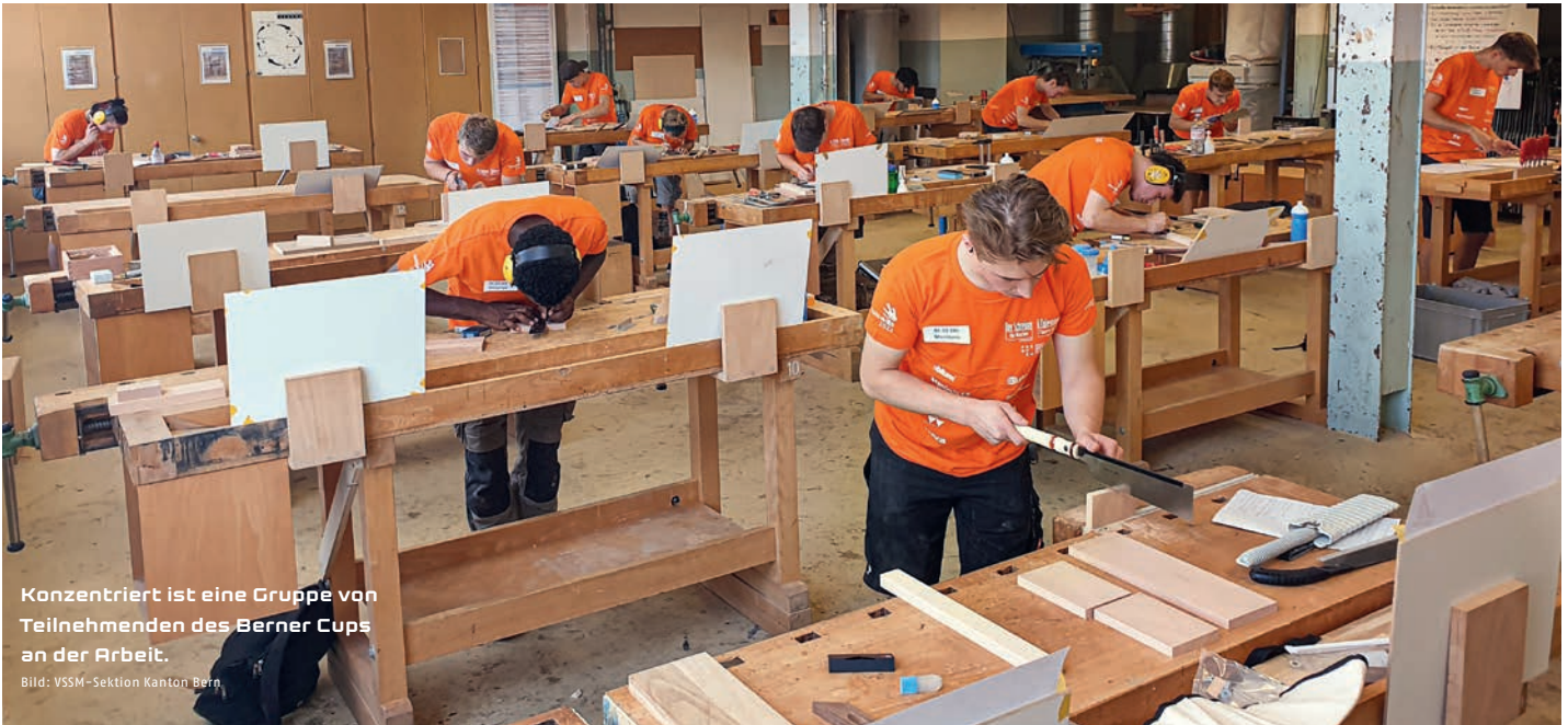
Konzentriert ist eine Gruppe von Teilnehmenden des Berner Cups an der Arbeit.