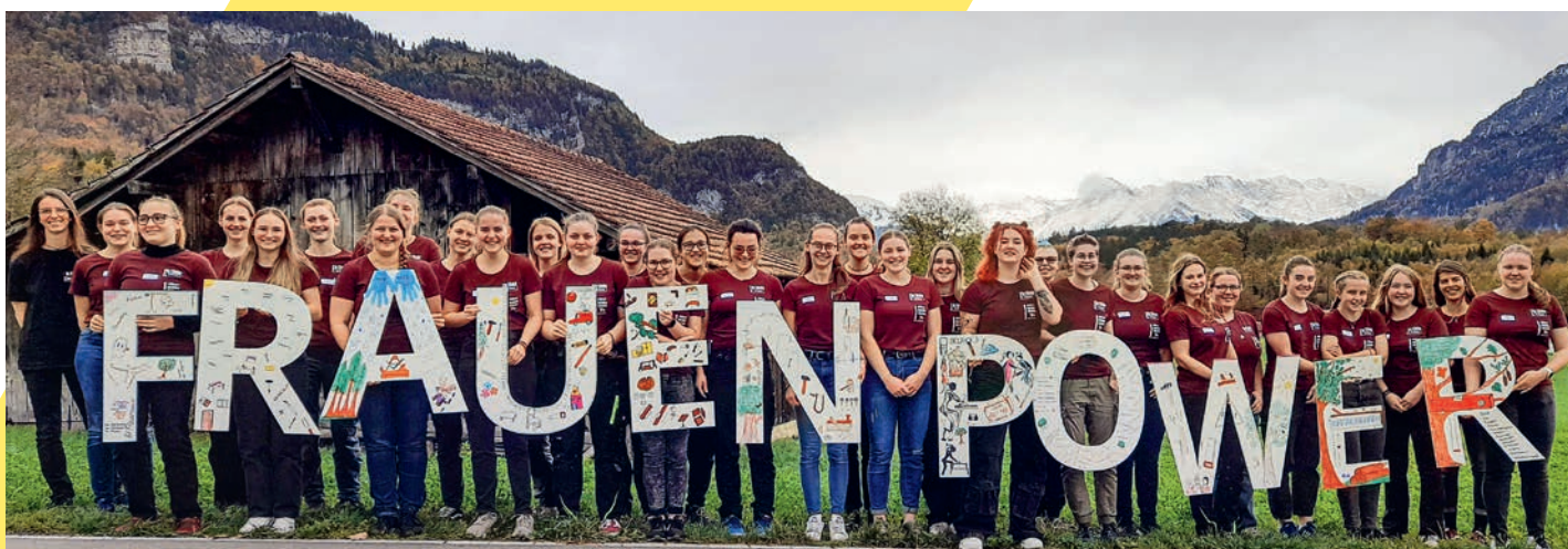
Die Teilnehmerinnen des Frauenförderungs-Workshops formieren sich zum Gruppenbild. Am letzten Tag kamen alle zusammen.